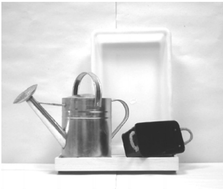
πρώτη φωτογραφία: μπροστινή όψη