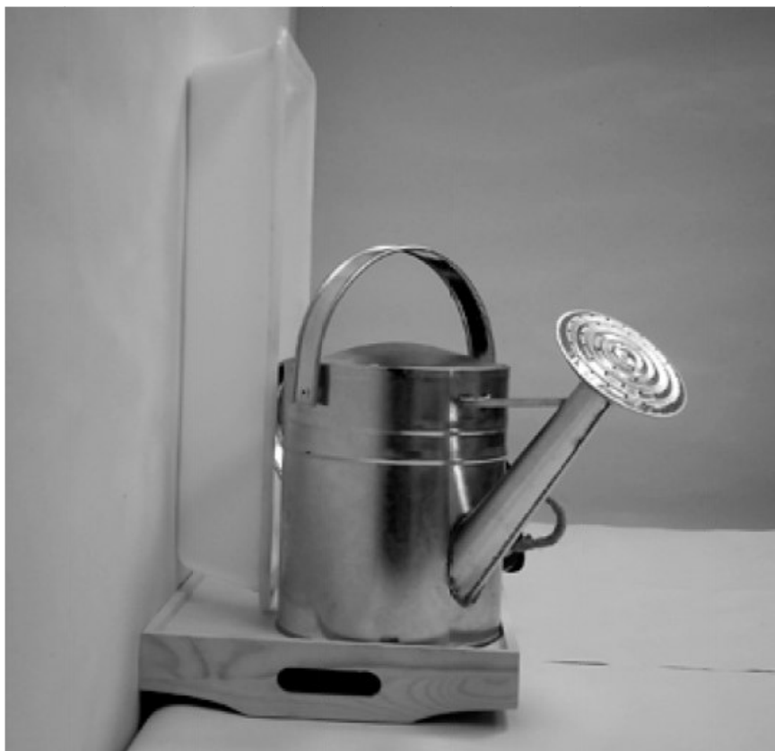
τρίτη φωτογραφία: πλάγια όψη