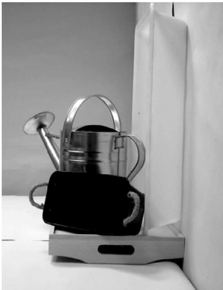
τέταρτη φωτογραφία: πλάγια όψη