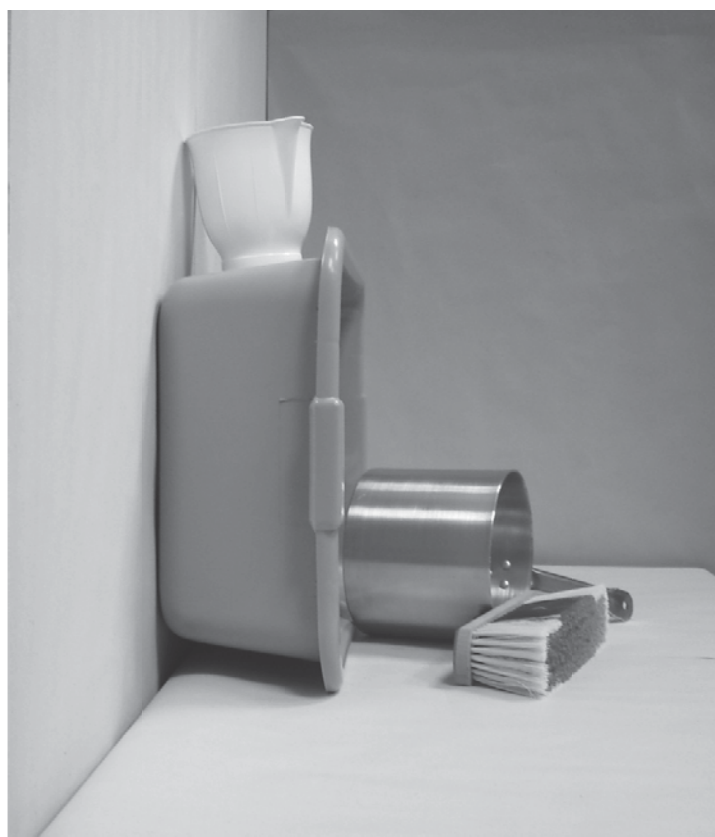
τέταρτη φωτογραφία: πλάγια όψη