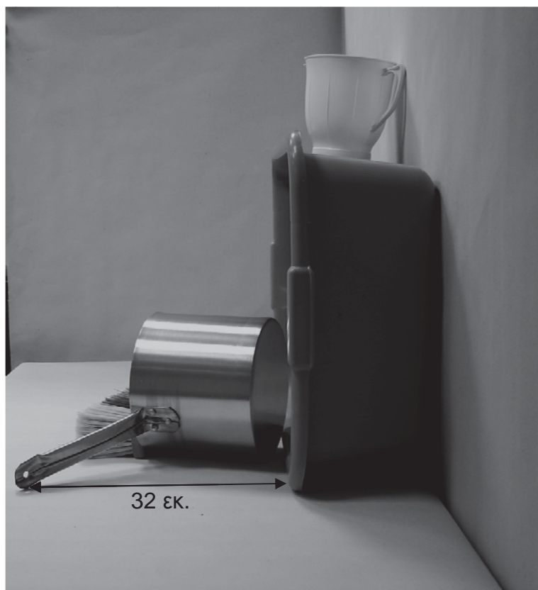
τρίτη φωτογραφία: πλάγια όψη