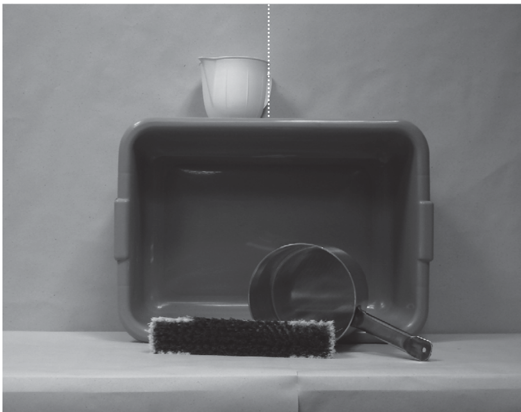
πρώτη φωτογραφία: μπροστινή όψη